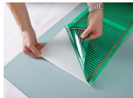
Heizfolie vom Trägermaterial abgezogen