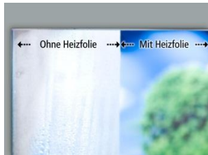
Vergleich: Vorher → Nachher

Beschlagene Spiegel gehören der Vergangenheit an!